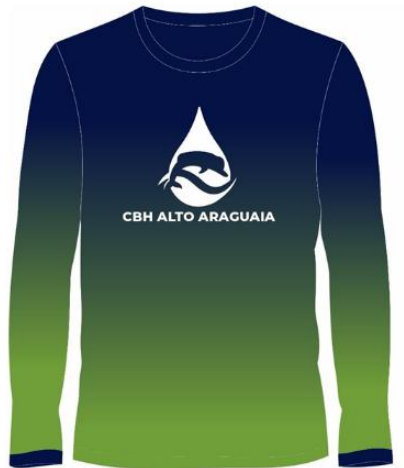
Figura 2- Logomarca a ser inserida no verso da camiseta.